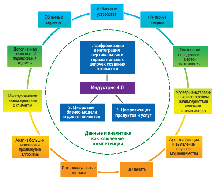
Рис. 1 Концепция программы «Индустрия-4.0» и соответствующие цифровые технологии

предусматривается цифровизация и интеграция процессов по вертикали в рамках всей организации, начиная от разработки продуктов и закупок и заканчивая производством, логистикой и обслуживанием. При этом все данные об операционных процессах, эффективности процессов, управлении качеством и операционном планировании доступны в режиме реального времени в интегральной сети. Используются также технологии дополненной реальности, а данные оптимизированы под различные платформы. Горизонтальная интеграция выходит за рамки внутренних операций и охватывает поставщиков, потребителей и всех ключевых партнеров по цепочке создания стоимости. В итоге используются различные технологии: от устройств слежения и контроля до комплексного планирования, интегрированного с исполнением в режиме реального времени.